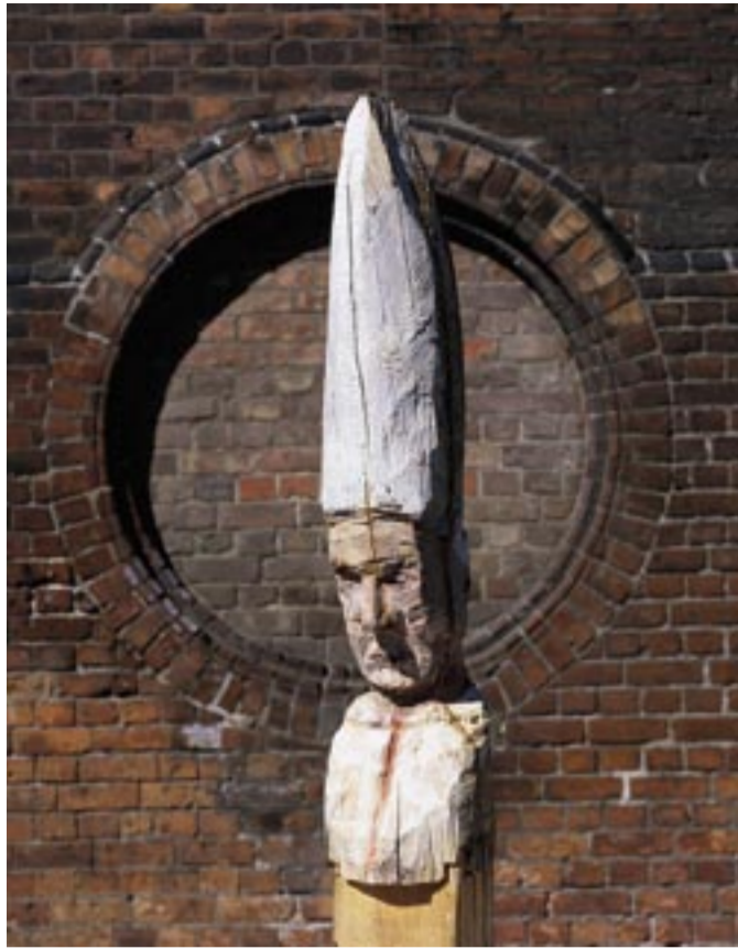
Ketzner, 2003 · Kiefer, bemalt · H 75 cm