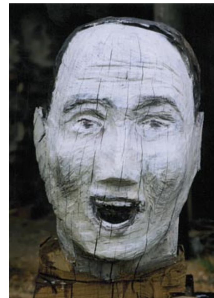
„Kopf laut lachend“ · 2003 · Eiche bemalt · H. 95 cm