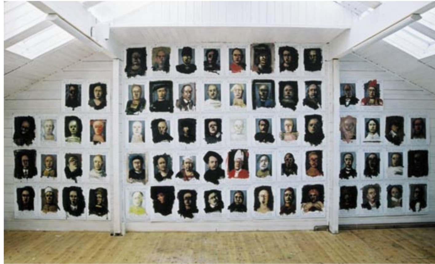
Atelierwand in Schönholz (Havelland) mit den Plakatübermalungen „103 Möglichkeiten die Zeit totzuschlagen – Meine Selbstporträts zwischen 1635 und 2003

In dieser Ausstellung zeigt Lutz Friedel Kopf – Skulpturen und Malerei auf Papier. Man könnte die Köpfe in den weiteren Zusammenhang der sogenannten „Maler – Plastik“ rücken, wie sie im 20. Jahrhundert durch Matisse, Degas, Picasso und andere bis hin zu Baselitz und Penck geschaffen wurde. Die unakademische, auf Oberfläche und Licht bezogene Skulpturauffassung und die enge Verbindung der Motive und Proportionen in beiden Medien würden darauf hinweisen. Aber Friedels Skulpturen sind zwar nach des Künstlers eigener Aussage „dilettantisch“ im positiven